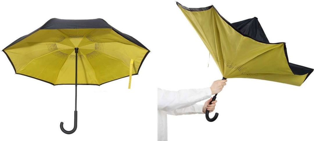
逆とじ傘 晴雨兼用 60cm DGU-6C-Y（カラー：アンバーヘイズ）