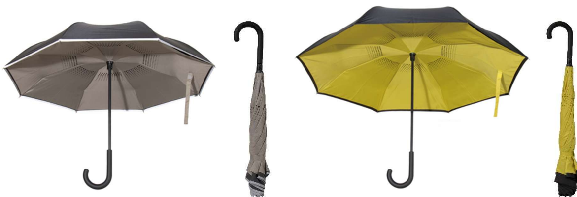
逆とじ傘 晴雨兼用 50cm DGU-5C-H (カラー：グレー)