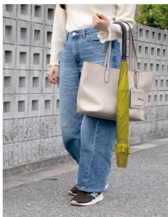
カバンと重ねて持つ時

傘をたたむと、雨で濡れた面が内側に収まる構造です。外側は乾いた状態になるので、束ねる時も手が濡れにくく、持ち歩き中も服やカバンへの水濡れを防ぎます。満員電車での気づかいや、自動車に乗り込む時のシートへの水濡れも減らせます。